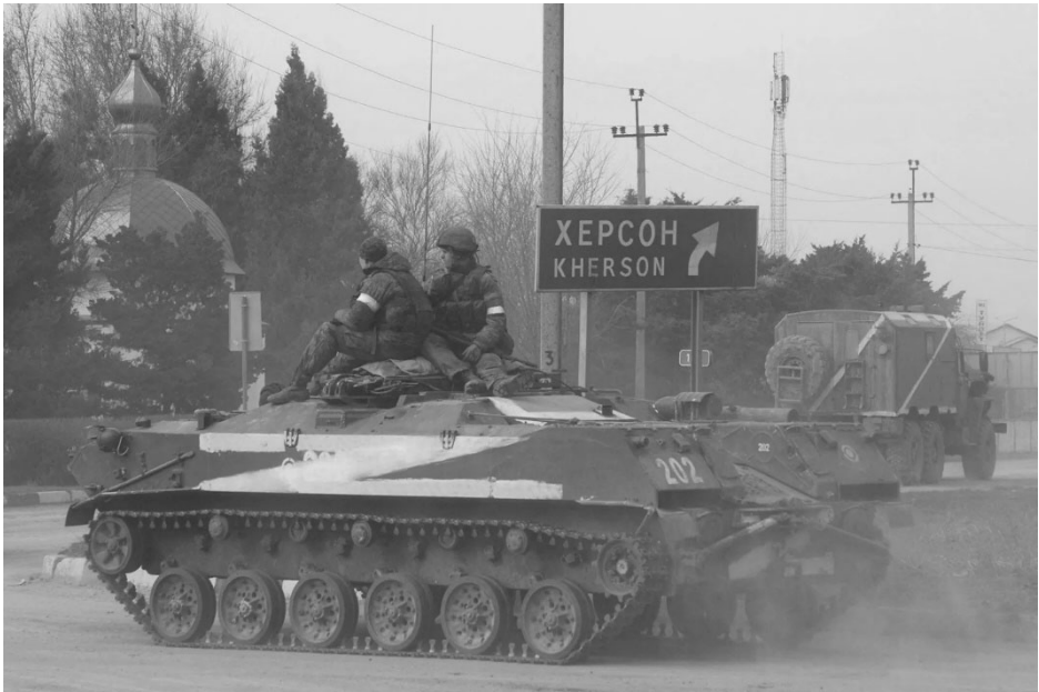
Cherson im April 2022

Nach Beginn des neuen Schuljahrs erhöhen die von Moskau eingesetzten Behörden weiter den Druck auf Lehrer, Direktoren und Angestellte der Schulaufsicht. Einige wurden bereits willkürlich verhaftet. 68 Weigert sich ein Schuldirektor zu kollaborieren, wird er ausgetauscht. Qualifikation spielt dabei keine Rolle, Loyalität mit den Besatzern ist das zentrale Kriterium für die Neubesetzung des Postens. Da viele Lehrer sich weigern, mit den Okkupanten zusammenzuarbeiten, werden in Russland Freiwillige rekrutiert. Ende Juli sollen sich 200 Lehrer aus Russland für einen Einsatz in der Ukraine gemeldet haben. 69 Auch die Eltern von Schülern werden unter Druck gesetzt. 70